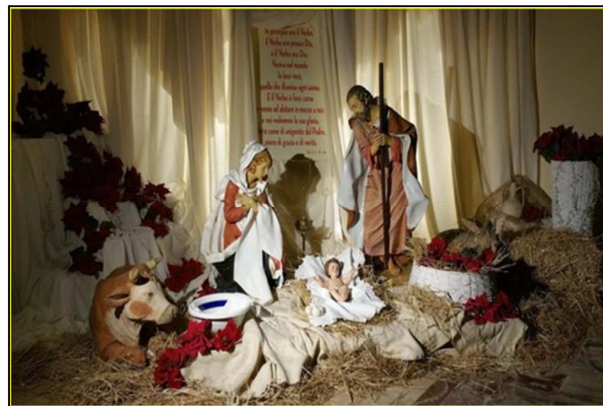
La Natività allestita nella chiesa del Sacri Cuori

Piazza Giovanni XXIII-e-mail: don_Carmine@libero.it - www.sacricuoricdf.it 87012 Castrovillari (Cs)